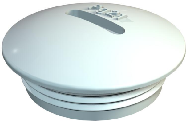
Bouchon de fermeture selon la norme DIN 46320, avec filetage PG selon la norme DIN 40430.