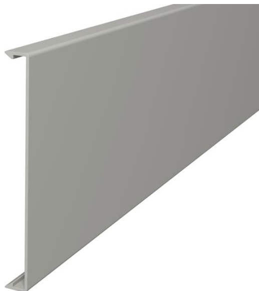
Couvercle pour l'obturation des goulottes.