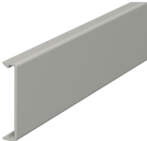
Couvercle pour l'obturation des goulottes.