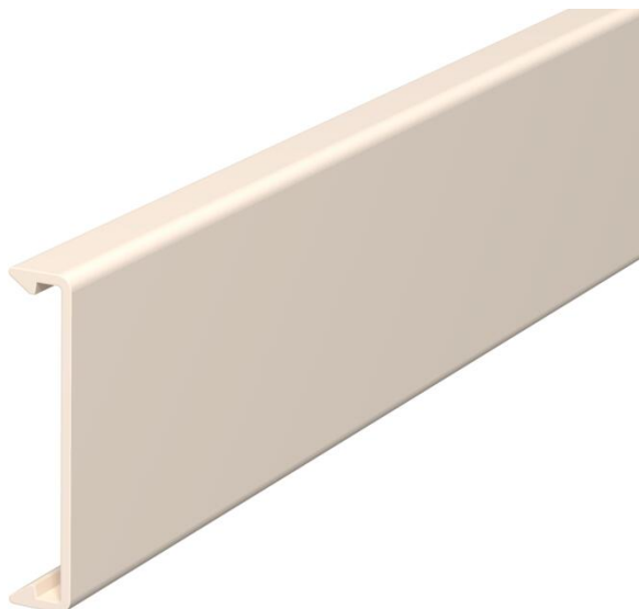
Couvercle pour l'obturation des goulottes.