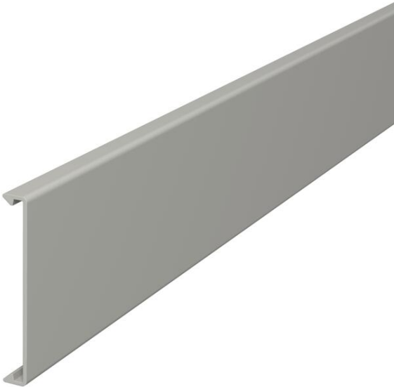
Couvercle pour l'obturation des goulottes.