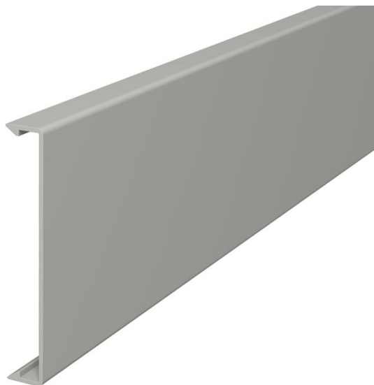
Couvercle pour l'obturation des goulottes.