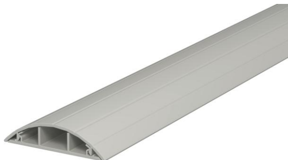
Kanaal en deksel met bodemperforatie.