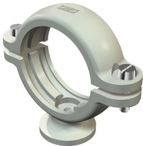
Collier isolant sur socle 45,5-47 mm