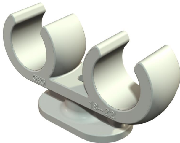
Collier de serrage sur socle pour 2 câbles 18-22mm