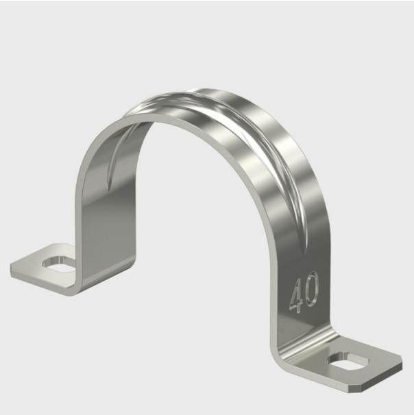
Collier à deux pattes de fixation pour câbles et tubes