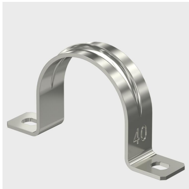
Collier à deux pattes de fixation pour câbles et tubes