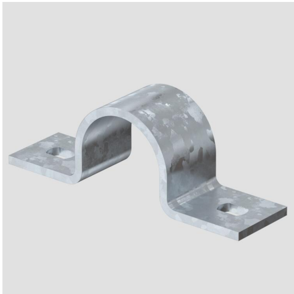
Collier de fixation avec deux pattes de fixation 32 mm