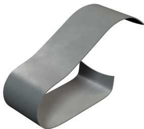
Pince de fixation pour câble 7-20 mm.