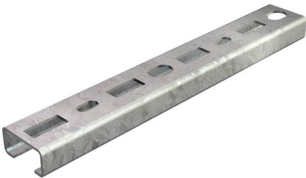
Rail profilé, perforé, ouverture 16 mm.