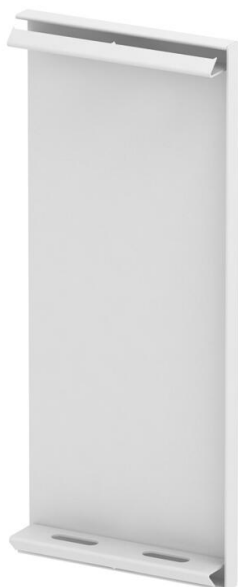
Eindstuk voor GEK-S wandgoot