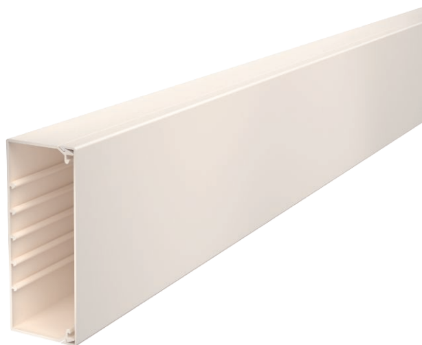
Kanaal en deksel met bodemperforatie.