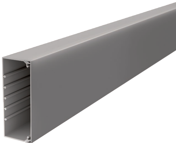
Kanaal en deksel met bodemperforatie.