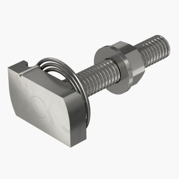
Vis à tête marteau à ressort pour rails profilés MS4121 et MS4141