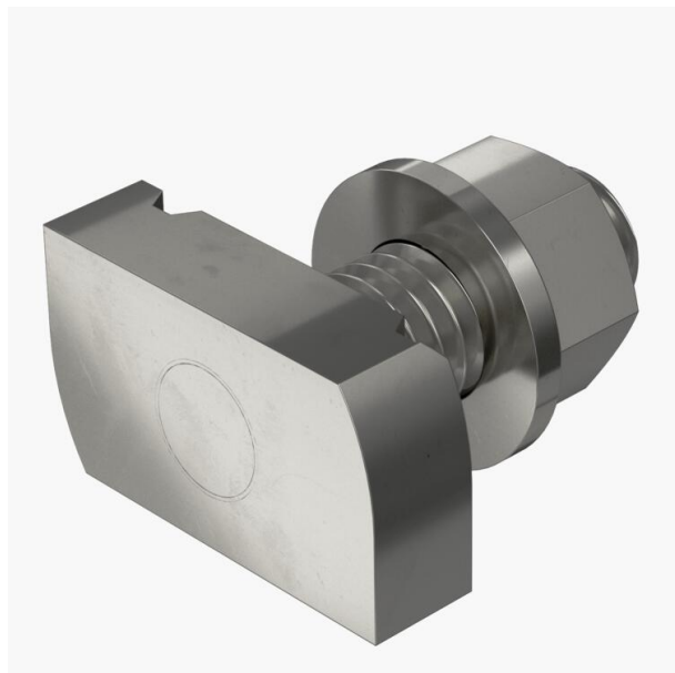
Hamerkopbout met veer voor gebruik met profielrails MS4121 en MS4141