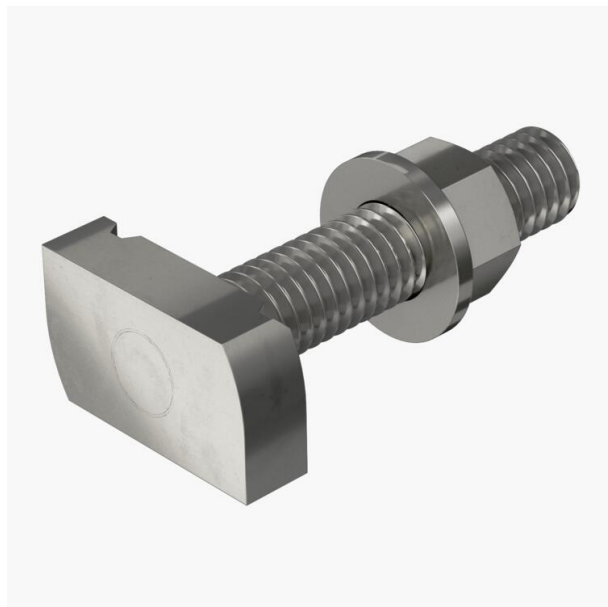
Vis à tête marteau pour rails profilés MS4121 et MS4141