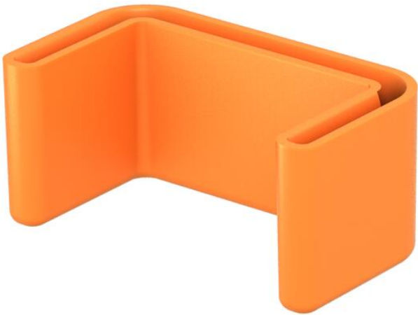
Embout de protection pour les extrémités des montants US 3.