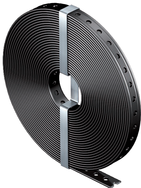
Ruban de montage perforé avec revêtement plastique en PE.