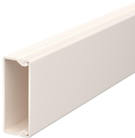
Kanaal en deksel met bodemperforatie.