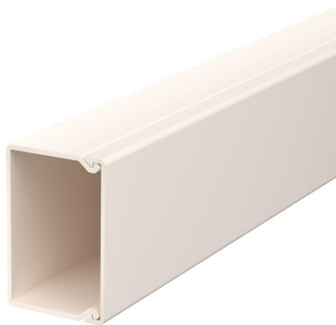
Kanaal en deksel met bodemperforatie.