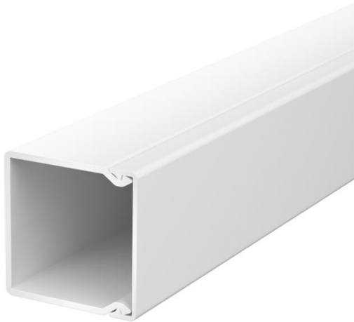
Couvercle et socle de goulotte avec fond perforé.