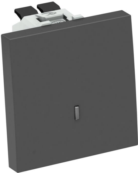
Interrupteur avec élément témoin LED, 1 pôle, 10 A, 250 V~, avec bornes à fiches