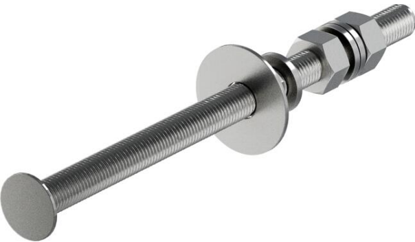
Unité de fixation pour trépied isFang sur 4 blocs FangFix.